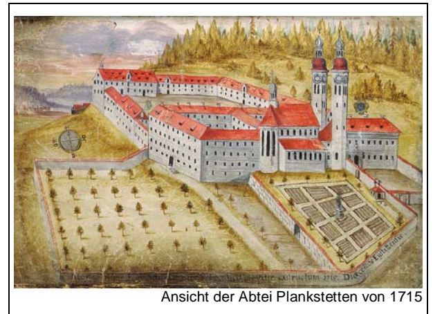
Ansicht der Abtei Plankstetten von 1715